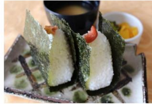
●おにぎり2個(梅・鮭)漬物・味噌汁