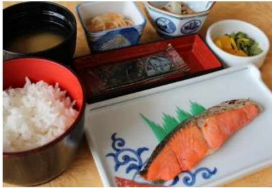
●焼魚・小鉢・納豆・焼海苔・漬物・ご飯・味噌汁付