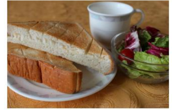
●トースト・サラダ・コーヒー付