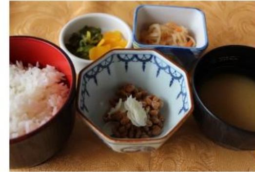
●納豆・ご飯・小鉢・漬物・味噌汁付