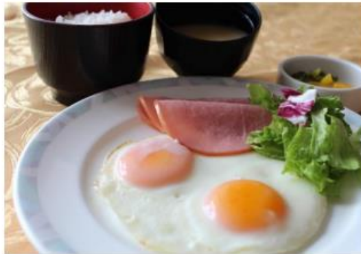
●ハムエッグ・ご飯・漬物・味噌汁付