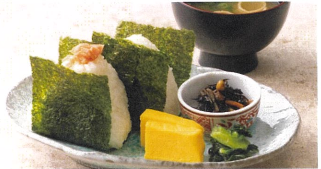
おにぎりセット(鮭・梅) 1,100円