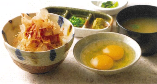
たまごかけごはん 北海道産たまごのTKG 1,100円